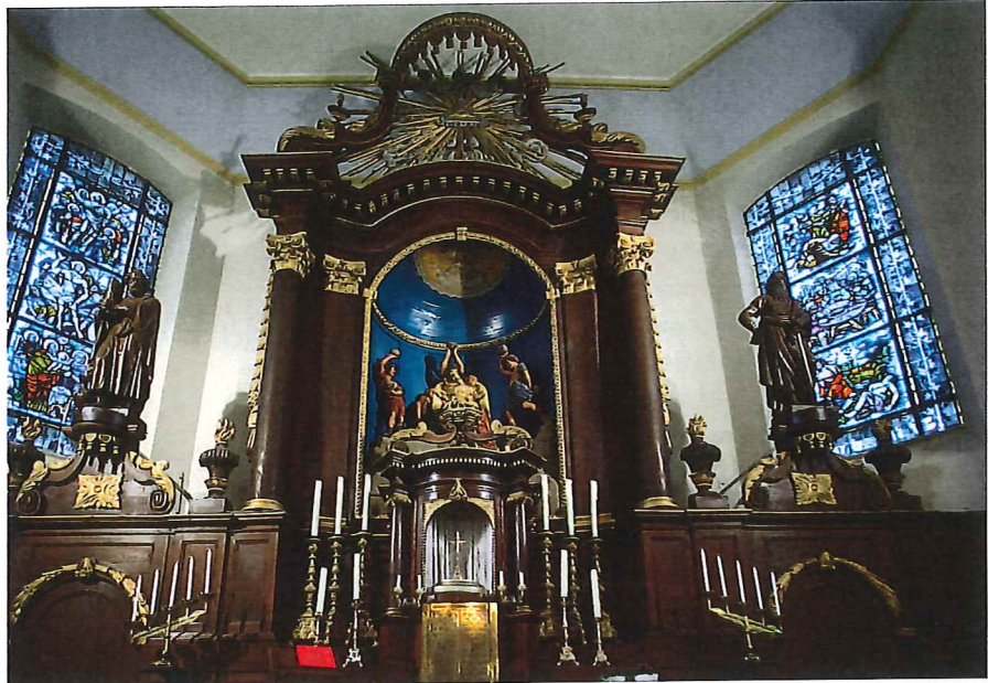
Zicht op het barokke hoofdaltaar

Wat daarbij zeker zal helpen is het karakter van de ‘eilandbewoners’ dat de pastoor na 16 jaar herderservaring in het stadje omschrijft als ‘zeer zelfbewust en redelijk chauvinistisch, gewend om de eigen boontjes te doppen’.